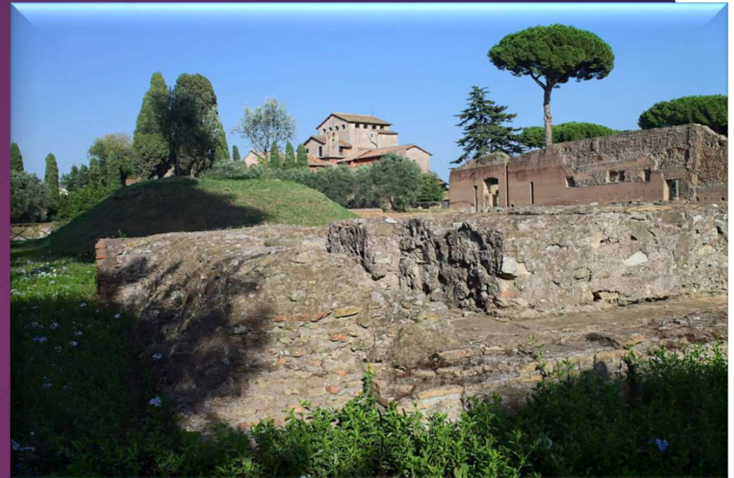
Mont Palatin, Rome.

Utiliser le langage audiovisuel pour se repérer