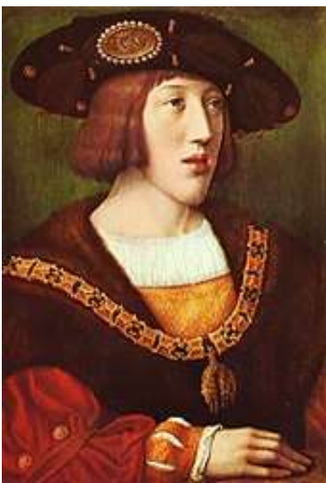
Portrait de Charles V (1500-58), à l'âge d'environ seize ans, 1516 · Bernard van Orley, Museo e Gallerie Nazionale di Capodimonte, Naples, Italie