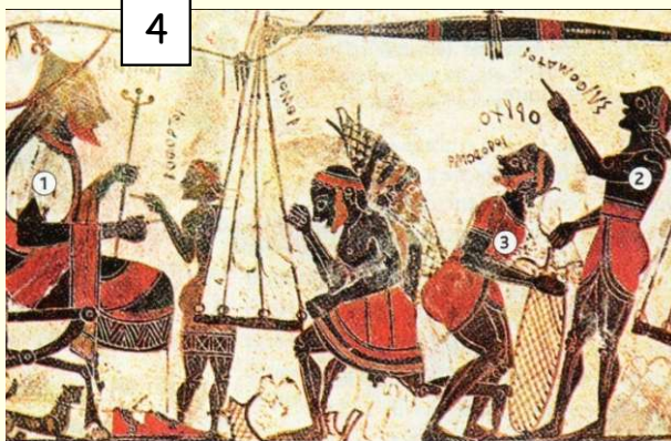
Arcésilas II ①, roi de Cyrène, assiste à la pesée du sylphion. Ses serviteurs écrivent des chiffres ② et emportent les sacs ③. Détail de la coupe d'Arcésilas II ; vers 560 av. J.-C., BNF, Paris.

Sylphion : une plante servant de médicament et d'épices, c'est un produit de grande valeur très recherché par les Grecs.