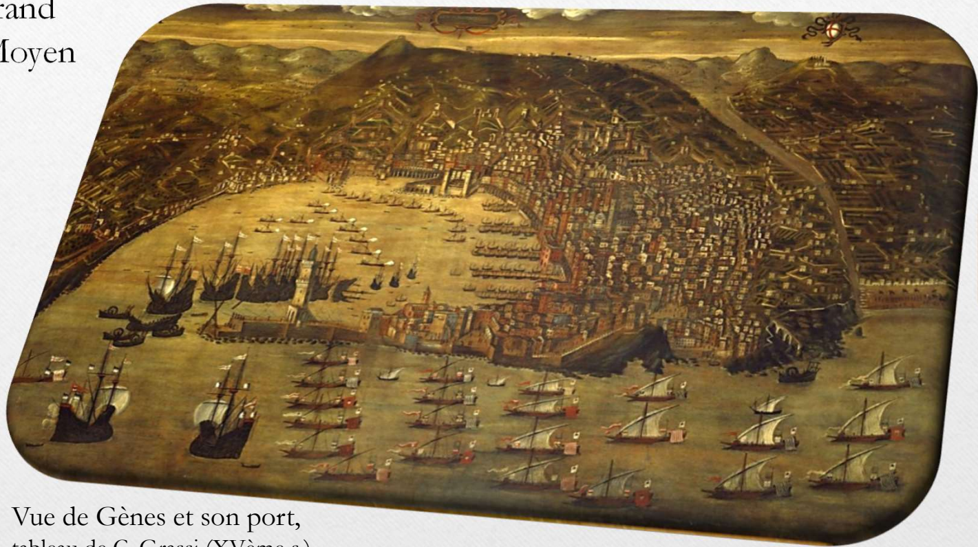
Vue de Gènes et son port, tableau de C. Grassi (XVème s.), Musée maritime de Gênes.)

Les villes du Grand commerce au Moyen Age (3'17 min)