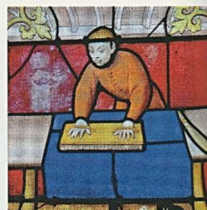
Le frisage pour apporter la finition au drap

3-Quelle est la nature de cette source, expliquez ses matériaux.