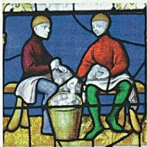
La tonte de la laine

Les artisans du drap, vitrail de la corporation des drapiers, vers 1460, Chapelle des drapiers, église Notre Dame de Semur-en-Auxois..