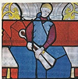
Le rasage pour égaliser le tissu