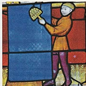
Le lainage pour assouplir le tissu