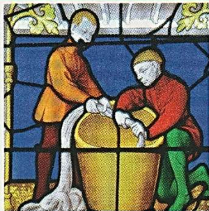
La teinture de la laine