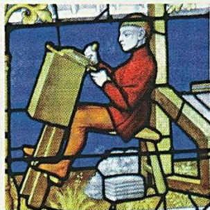
Le peignage de la laine