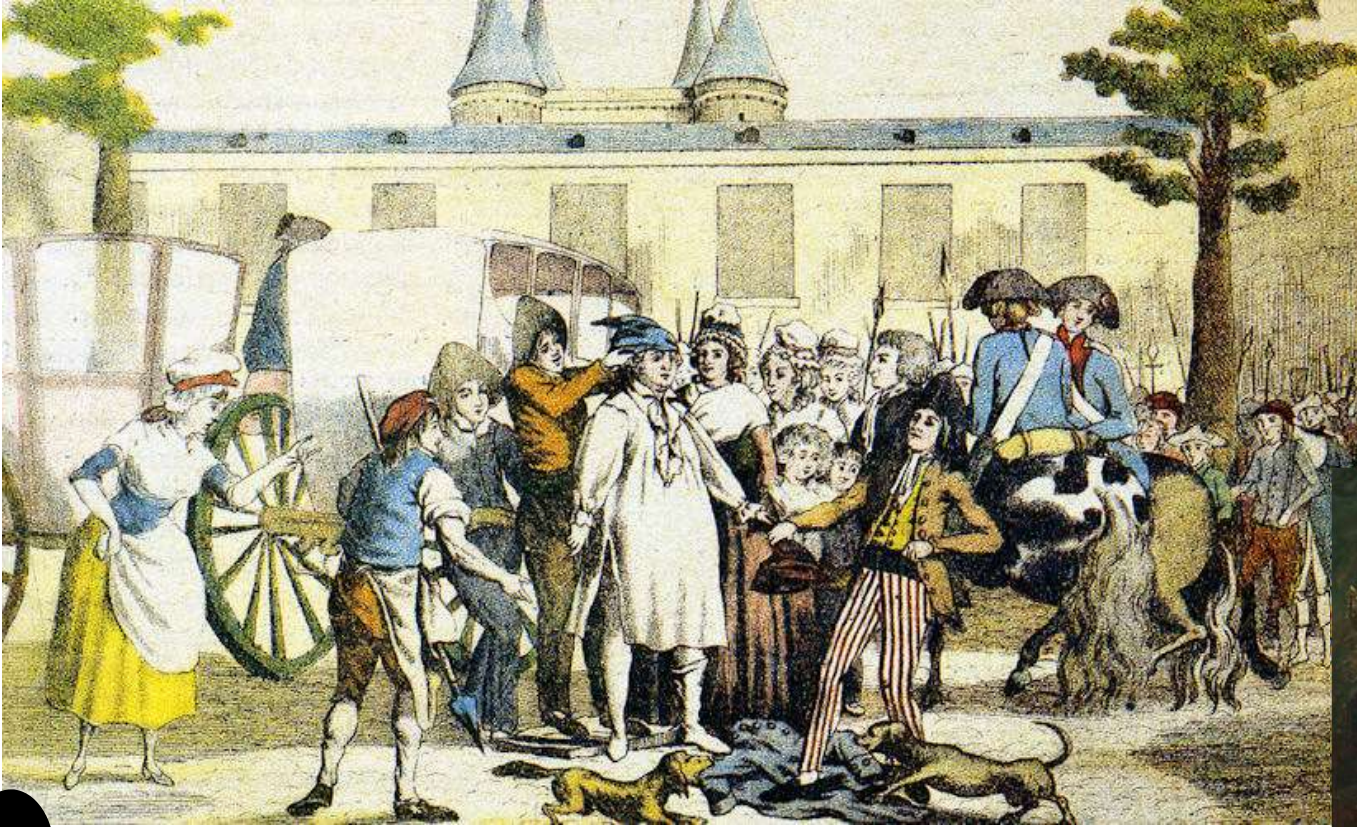
1 Louis XVI conduit à la Prison du Temple, gravure, 1792, musée Carnavalet, Paris

1- doc 1 : Comment est racontée la destitution du Roi sur la gravure ci-dessus ?