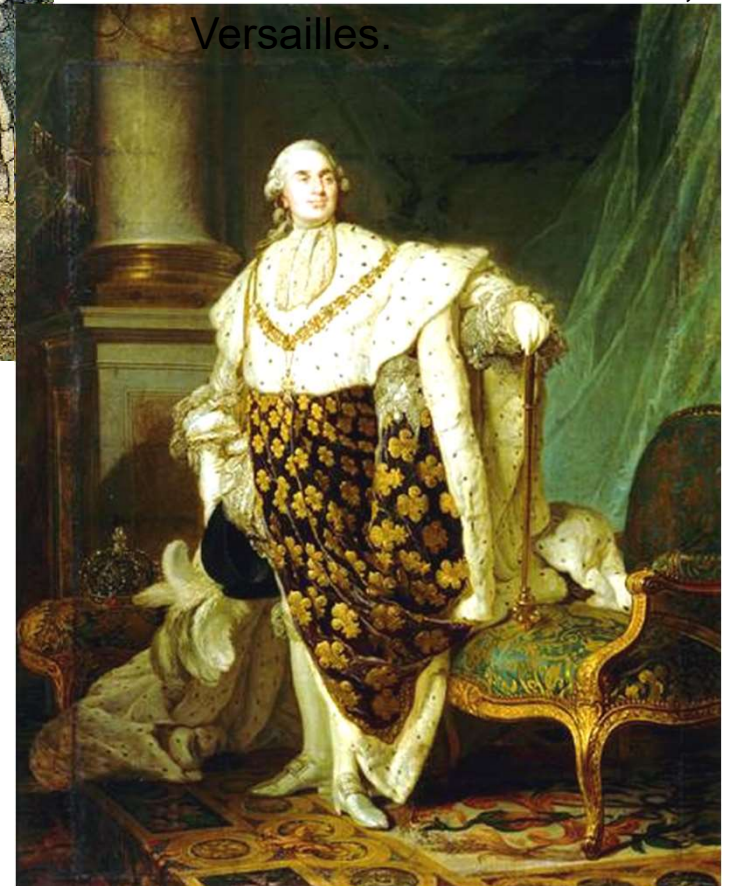
2 Louis XVI roi de France, Joseph-Siffred DUPLESSIS, 1777, musée du Château de Versailles, Versailles.

3- Quelles peuvent être les nouvelles références politiques pour diriger la France ?