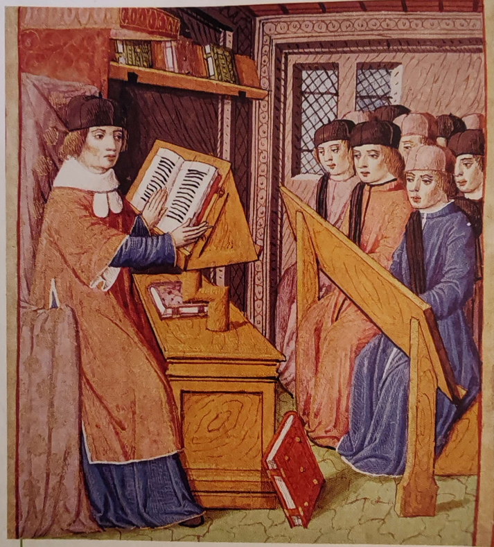
6 Un cours à l'université (Miniature du XV e siècle, Bibliothèque municipale, Dijon.)