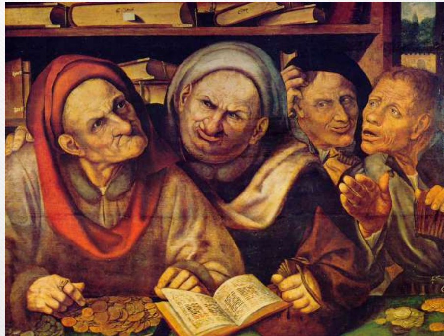
Les usuriers , tableau de Quentin Metsys (1520)

[ Bible, Ancien testament, Lévitique, 25.37 ]