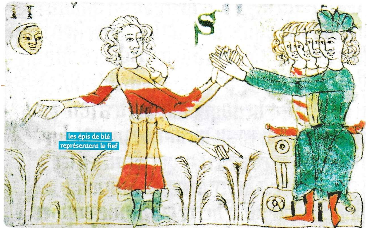
Miniature du XIV e s., Bibliothèque universitaire de Heidelberg, Allemagne.

1 . Morceau du corps d'un saint ou objet lui ayant appartenu, qui est conservé et vénéré.