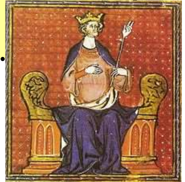
Hugues Capet couronné roi des Francs. Enluminure ornant un manuscrit du XIII e ou XIV e s., Paris, BNF.