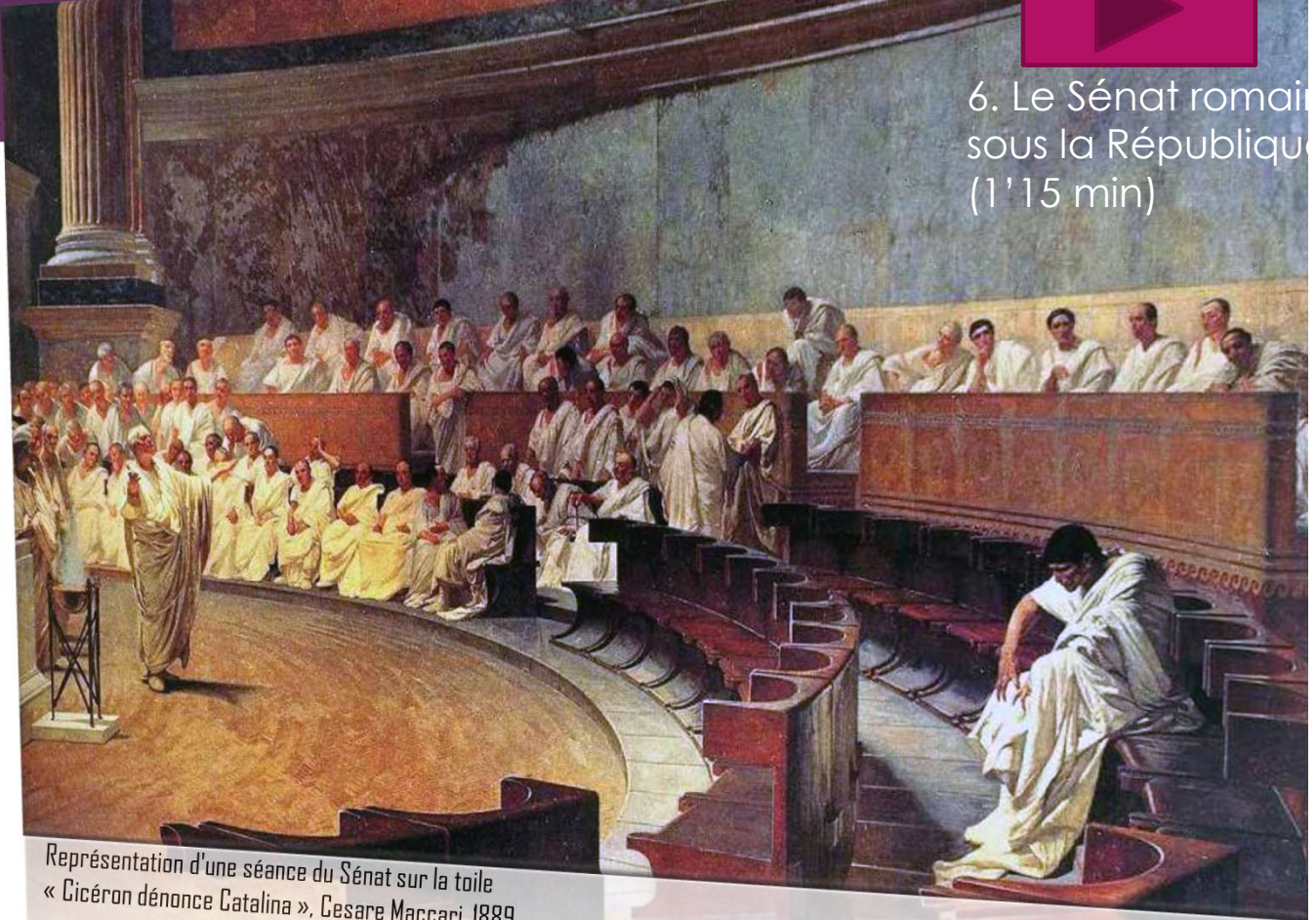
Représentation d'une séance du Sénat sur la toile « Cicéron dénonce Catalina », Cesare Maccari, 1889.

Vous êtes sénateur, les consuls pour l'année ont demandé au Sénat de préparer la visite du jeune prince à Rome.