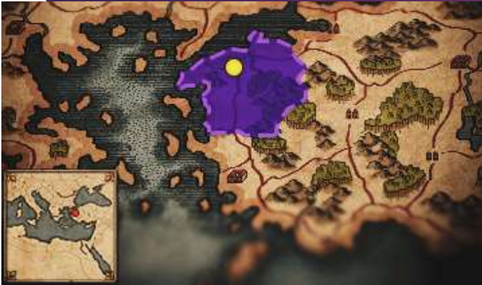
Royaume de Pergame

Nous sommes en 152 av J.-C., le royaume de Pergame, un de vos alliés en Méditerranée envoie en ambassade Attale, un jeune homme de 15 ans environ, neveu du roi Attale II, qui est prédestiné à sa succession.