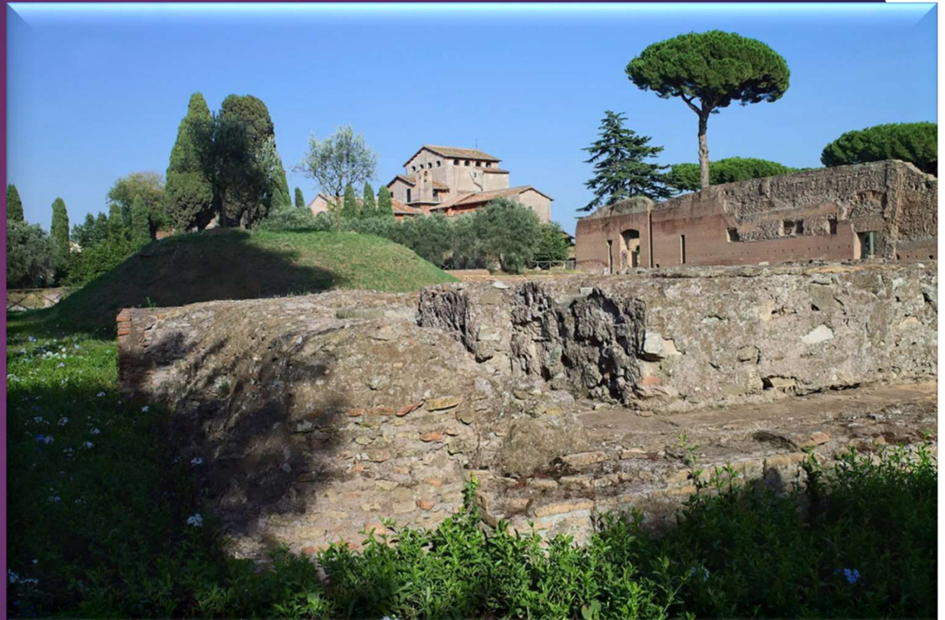
Mont Palatin, Rome.

Utiliser le langage audiovisuel pour se repérer