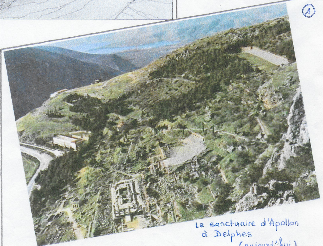
Le sanctuaire d'Apollon à Delphes (aujourd'hui)