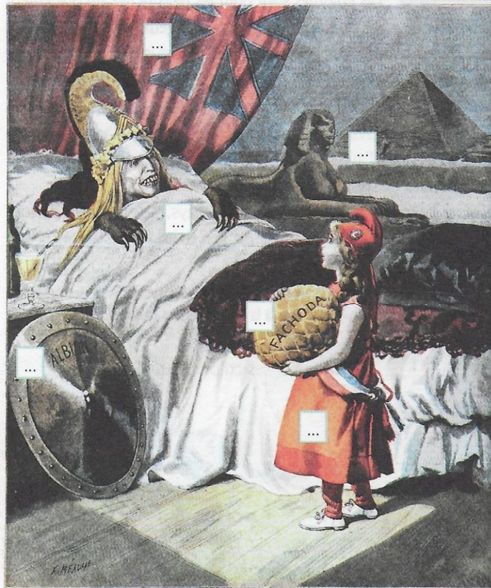
LE PETIT CHAPERON ROUGE

Le Petit Journal SUPPLÉMENT ILLUSTRÉ Le Supplément Illustré Huit pages CINQ centimes Mardi 20 novembre 1898 DIMANCHE 20 NOVEMBRE 1898 Numéro 418